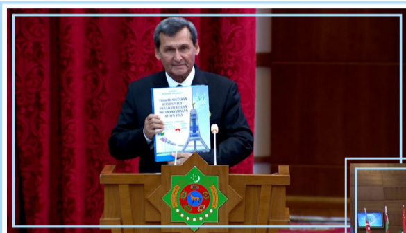
Президента Сердара Бердымухамедова «Нейтралитет Туркменистана — светлый путь мира и доверия». В мероприятии приняли

Участники презентации поздравили Героя-Аркадага и Аркадаглы Героя Сердара с выходом в свет книги «Нейтралитет Туркменистана — светлый путь мира и доверия», выразили искрен-